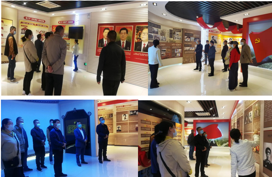
培训部党支部组织党员和党外知识分子参观党校党史展厅