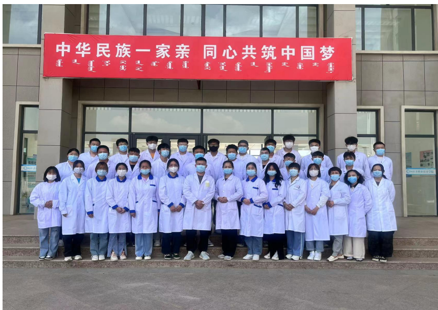
培训部为在校生集中开展职业技能等级认定考核工作