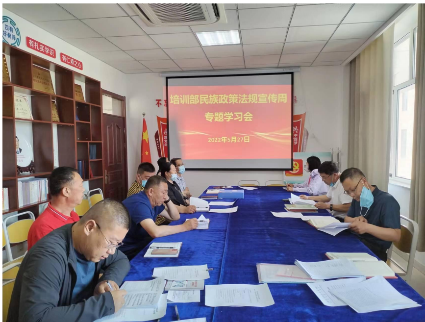
图为培训部召开 2022 年民族法治宣传周专题学习会现场

通过参加以上民族政策法规学习教育活动，培训部全体党员和教职工进一步增强了政治自觉，深入学习贯彻习近平总书记关于加强和改进民族工作的重要思想，紧紧围绕铸牢中华民族共同体意识主线，以实际行动捍卫“两个确立”，践行“两个维护”，完整准确全面贯彻党的民族理论和民族政策，牢固树立休戚与共、荣辱与共、生死与共、命运与共的共同体理念。培训部组织活动中，注重守正创新，提升工作质效，创新民族政策、民族法规宣传教育方式，加大互联网加民族政策宣传教育力度等途径开展民族政策宣传月和民族法治宣传周活动，做到有形有感有效推动党的民族理论政策宣传教育多角度、全方位、全覆盖、常态化、全员化开展，推动党的民族政策入户、入脑、入心，促进学院民族工作高质量发展。