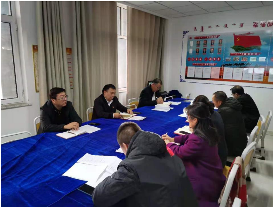
图为培训部党支部党员专题组织生活会现场