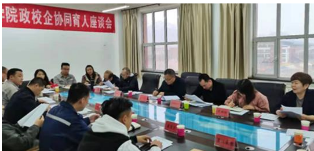
图为学院政企协同育人座谈会现场