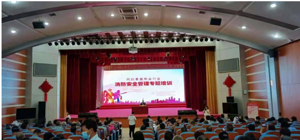
培训部党支部为物业行业开展公益性消防安全专题讲座