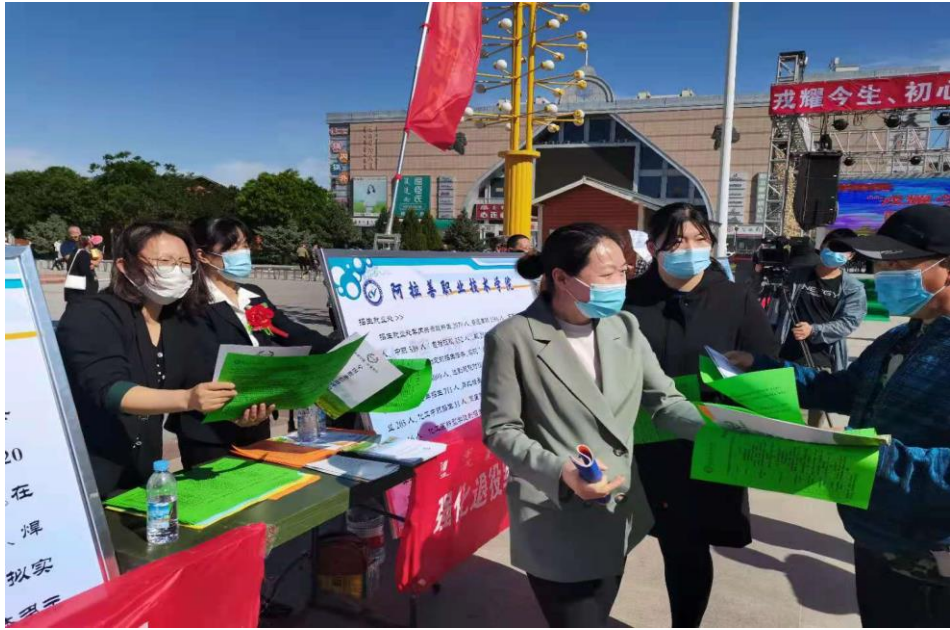
培训部党支部组织党员和教职工为社区群众开展咨询服务