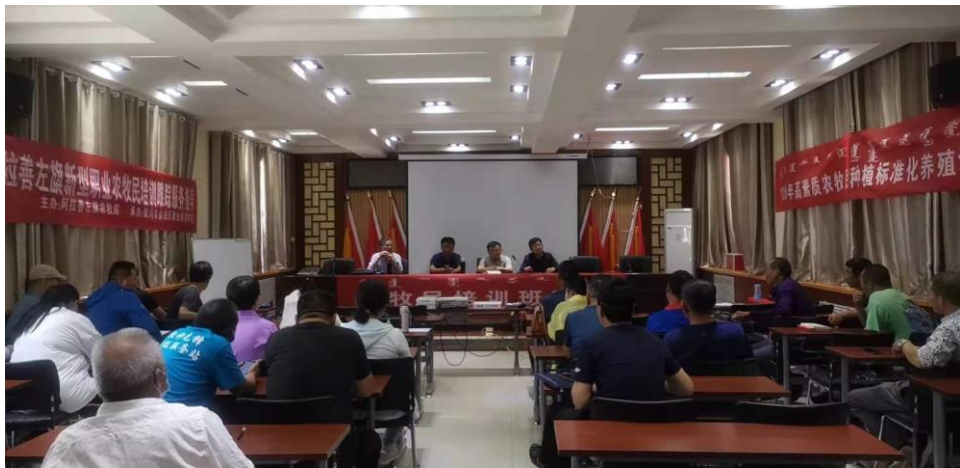
培训部党支部组织专家深入农牧区开展技术咨询回访活动