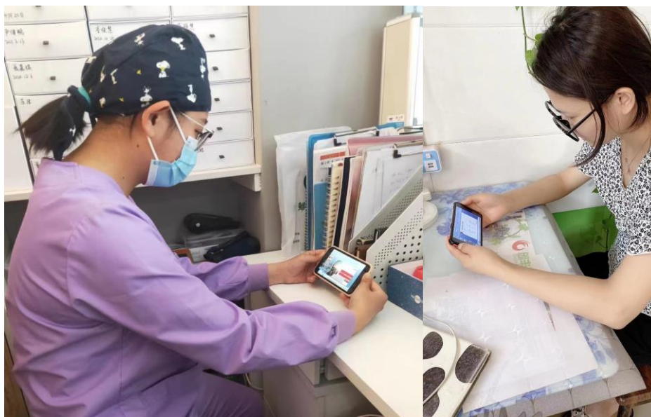
参加网上创业培训的我院高职毕业生通过手机端学习视频课程