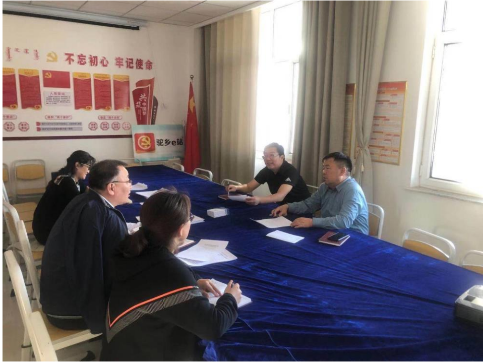
图为培训部党支部 2020 年度民主评议党员组织评定现场