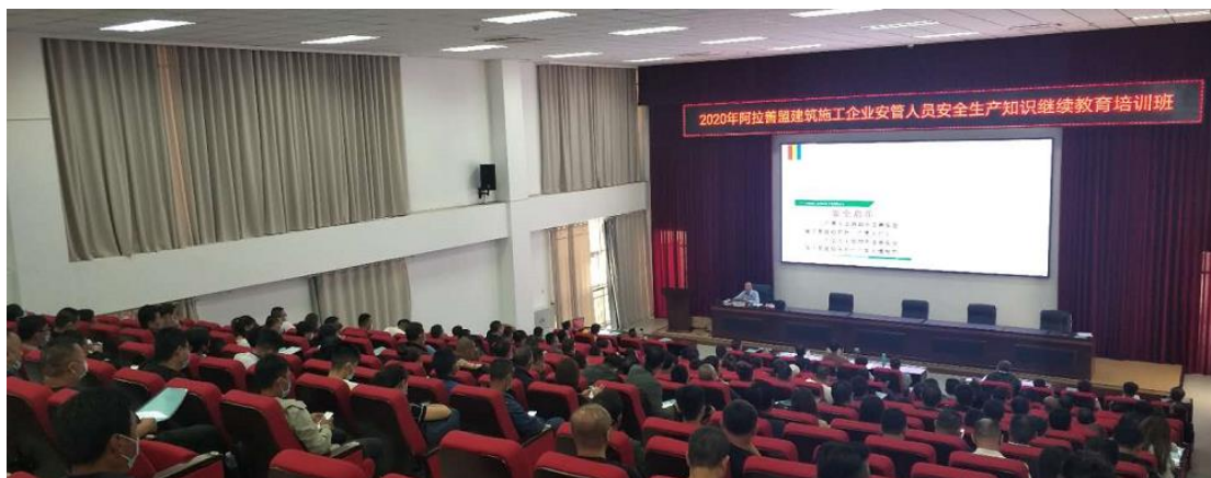
图为学员学习现场