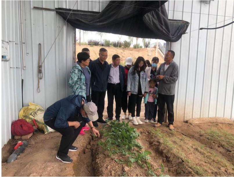
图为培训部党员和教职工参观种植项目