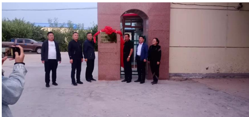
图为培训部党总支持书记与公司王总为培训示范点揭牌