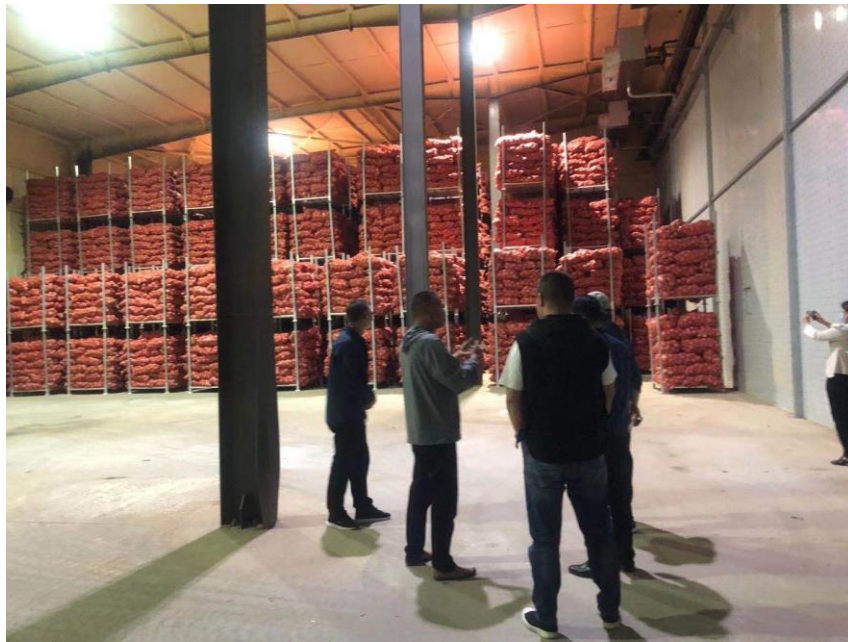
图为培训部党员和教职工参观蔬菜水果冷藏库