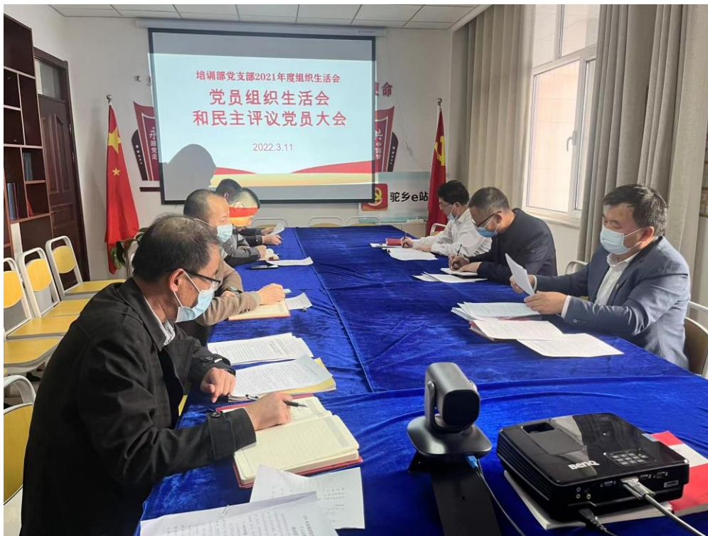
图为培训部党支部召开 2021 年度组织生活会和民主评议党员大会