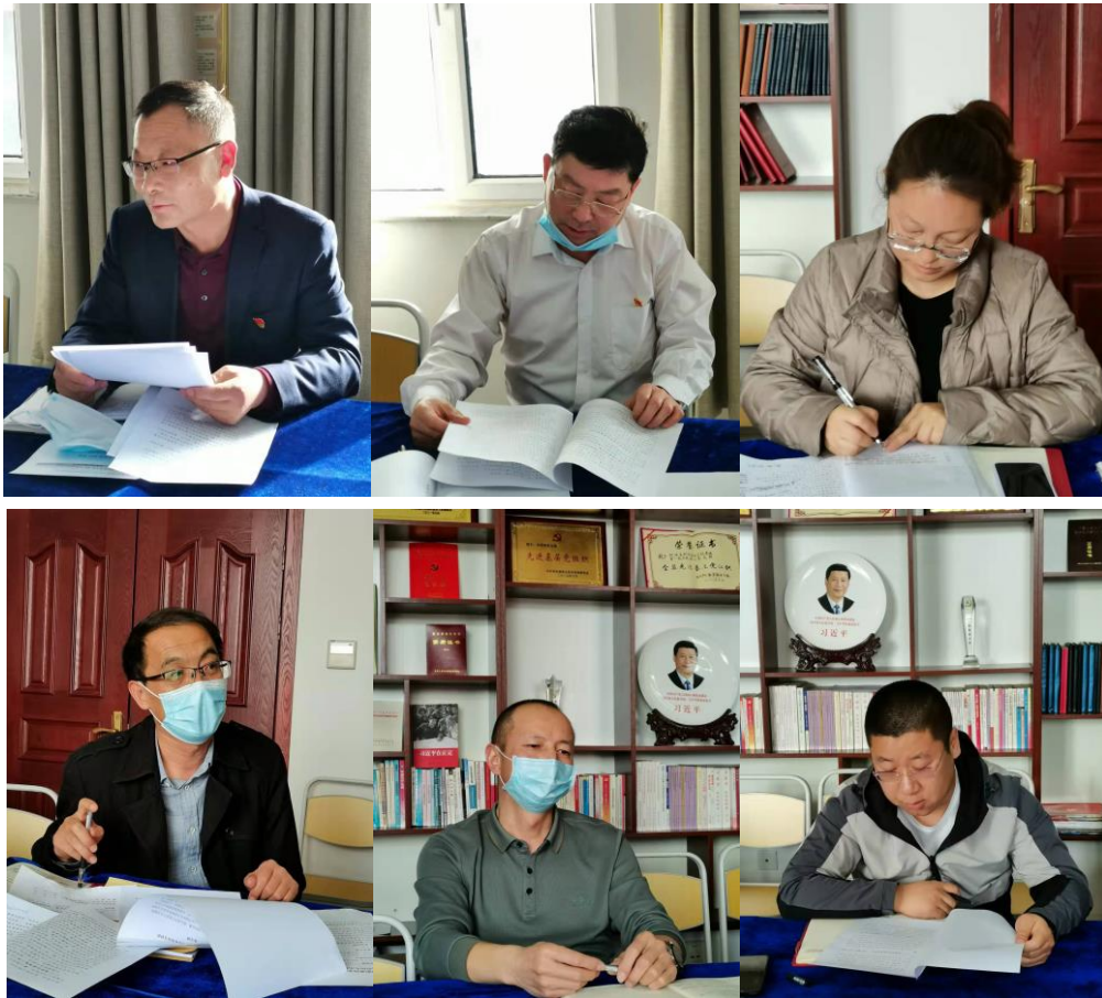
图为培训部党支部召开 2021 年度组织生活会开展批评与自我批评