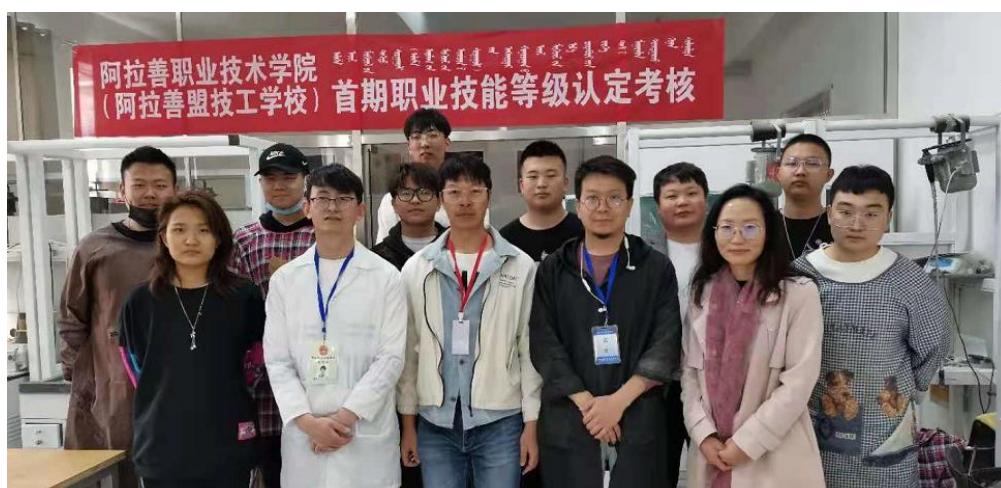
图为考评员与部分考生合影