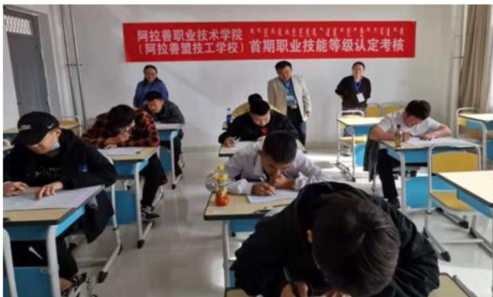
图为理论考试现场

开展首期社会化职业技能等级认定工作给予肯定，并就大力开展技能型人才培养考评工作提出了具体要求和意见。本次玉雕工职业技能等级认定考核工作，在艺术系的大力支持下，经过考评员客观公正的评估，于当天下午顺利完成。